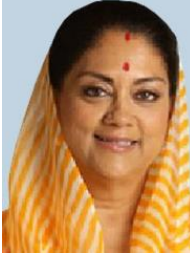
श्रीमती वसुन्धरा राजे माननीया मुख्यमंत्री, राजस्थान सरकार